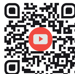
COME FUNZIONA MODE DE FONCTIONNEMENT