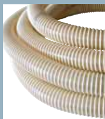
Tubo antistatico Antistatic pipe