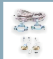
Kit di sollevamento Kit de levage