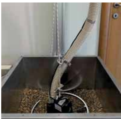
Spider in posizione di lavoro Spider en position de travail

Le kit facilite le levage de Spider du magasins de stockage durant les déchargements et les maintenances.