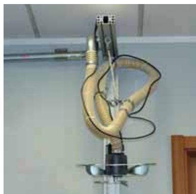
Spider sollevato durante il rifornimento Position Spider durant l'approvisionnement