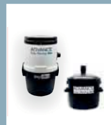
Separatore polveri Séparateur de poussières