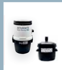
Separatore polveri Staubabscheider