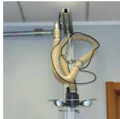
Spider sollevato durante il rifornimento Position Spider beim Befüllen