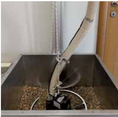
Spider in posizione di lavoro Spider in Arbeitsposition

Der Bausatz erleichtert das Herausheben des Spider aus dem Tank bei der Befüllen und Wartung.