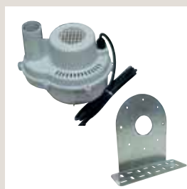
Modulo motore con supporto