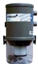
Centrale aspirante Nova 2