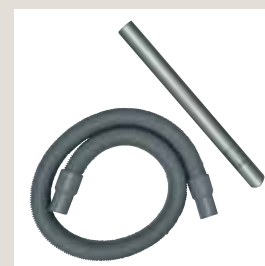
Tubo flessibile aspirazione combustibile con lancia

Pochi componenti base componibili e adattabili a ogni situazione impiantistica per offrire la massima semplicità di installazione senza compromettere il design dell'ambiente dov'è installato il caminetto.