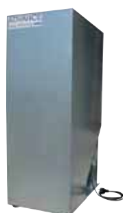
Magazzini motorizzati M-TANK