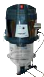
Centrale aspirante integrata Nova 3