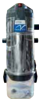
Centrale aspirante Nova 1 Plus