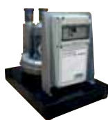
Modulo motore induzione 380 Volt 2,2 kW