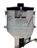
Dosatore Dispenser (trasparente)