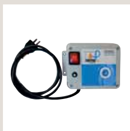
Centralina di controllo