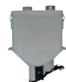
Dosatore Dispenser (rettangolare)