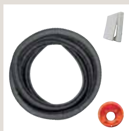
Presa aspirante, contropresa e tubo flessibile antistatico