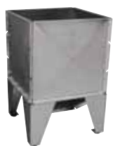
Magazzino stoccaggio Midi a tramoggia