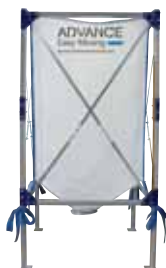
Magazzino stoccaggio Texsilo 120