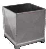
Magazzino stoccaggio Midi a fondo piatto